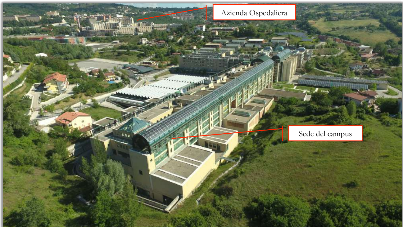
Immagine dell'aerea del campus universitario di Macchia Romana

Durante la fase di avvio saranno utilizzate alcune infrastrutture esistenti, che saranno preventivamente riadeguate, tra cui aule e laboratori didattici.