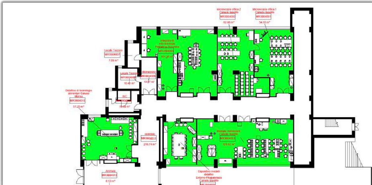
Gruppo di laboratori di supporto per la prima fase di avvio del corso di laurea

Si prevede di condividere l'utilizzo di un gruppo di due laboratori didattici tra quelli ubicati al quarto piano dell'edificio 3B.