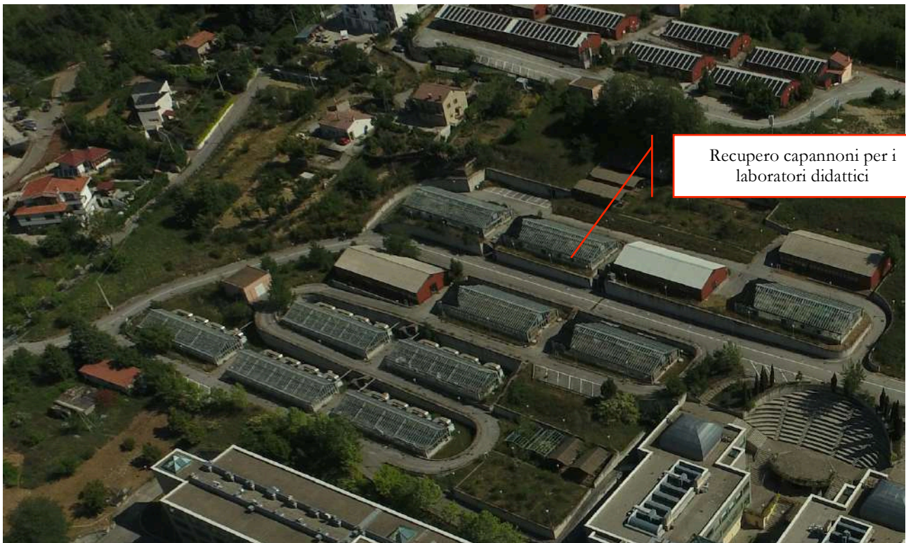
Area destinata ad ospitare i laboratori didattici

Si prevede nello specifico di recuperare tre capannoni.